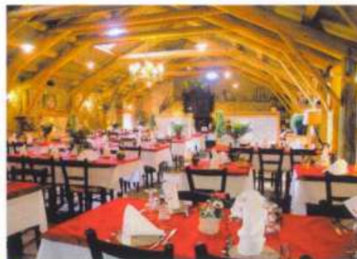
Table conviviale, dans une ancienne grange aménagée où naturalité et authenticité sont les maîtres mots. Vous apprécierez les balades proches de l'hôtel et en soirée, la convivialité du lieu.

A la fois gastronomique et traditionnelle, la cuisine du chef vous révélera les mets et richesses de la Margeride, pays des vertes prairies et des vallées profondes.